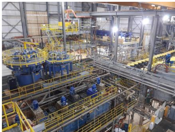
Nouveau WHIMS (à gauche) et espace de déchargement (à droite)