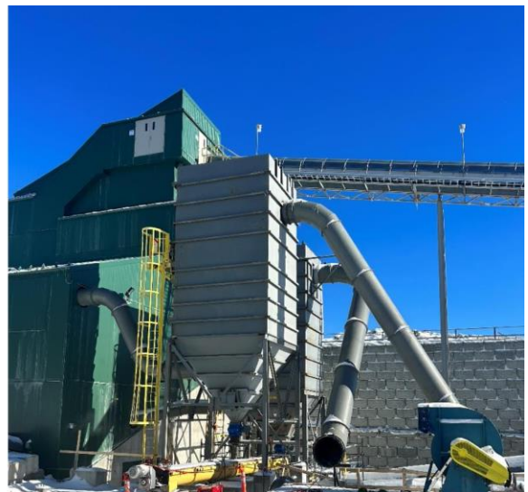
Goulottes, convoyeur et alimentateur du trieur de 3e minerai (gauche) ; installation de dépoussiérage (droite)