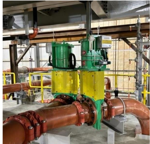
WHIMS à revêtement en caoutchouc (à gauche) ; vannes (à droite).